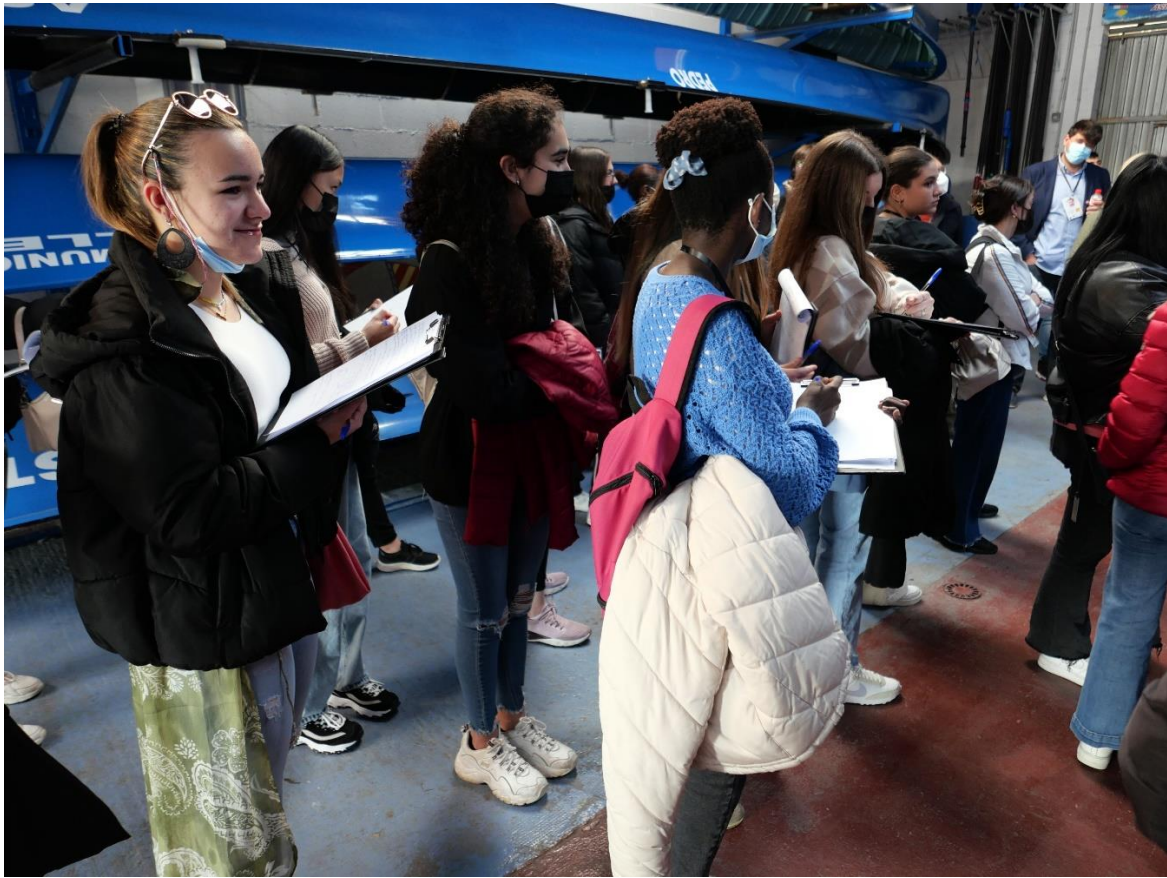
Obiskali smo veslaški klub Astillero. Tu so nam predstavili različne oblike veslaških čolnov.