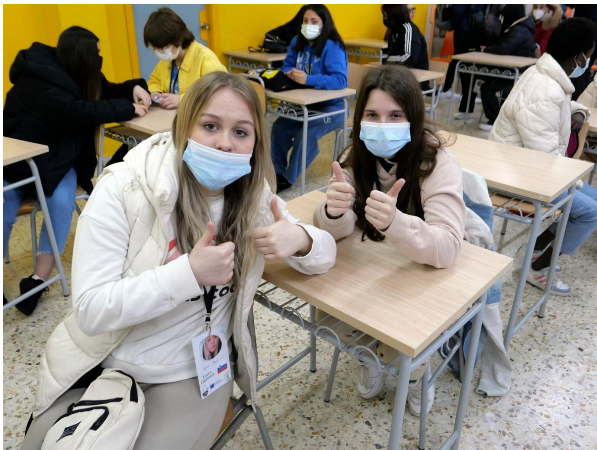
Med sprejemom na srednji šoli I.E.S EL ASTILLERO, gostiteljici srečanja

V tednu med 3. 4. in 9. 4. 2022 je v španskem mestecu Astillero, ki se nahaja v španski avtonomni skupnosti Kantabriji, potekalo srečanje dijakov in učiteljev v okviru Erasmus+ KA2 projekta z naslovom Turizem, inovacije trajnost. Srečanja se je udeležilo 16 dijakov in 9 učiteljev iz Francije, Italije, Turčije in Slovenije. Dijaki so v času srečanja bivali pri družinah dijakov španske šole, gostiteljice srečanja. Domačini so nam pripravili pester program, v tednu, ki smo ga preživeli skupaj, smo obiskali številne turistične institucije, ki upravljajo različne turistične destinacije po načelih trajnosti, dijaki pa so posneli intervjuje z osebami, ki te institucije upravljajo.