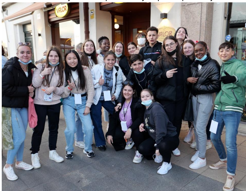
Na promenadi mesta Santander, potem ko smo se temeljito okrepčali s Churrosi, ocvrtimi sladkimi palčkami, ki jih je obvezno treba pomakati v vročo čokolado.