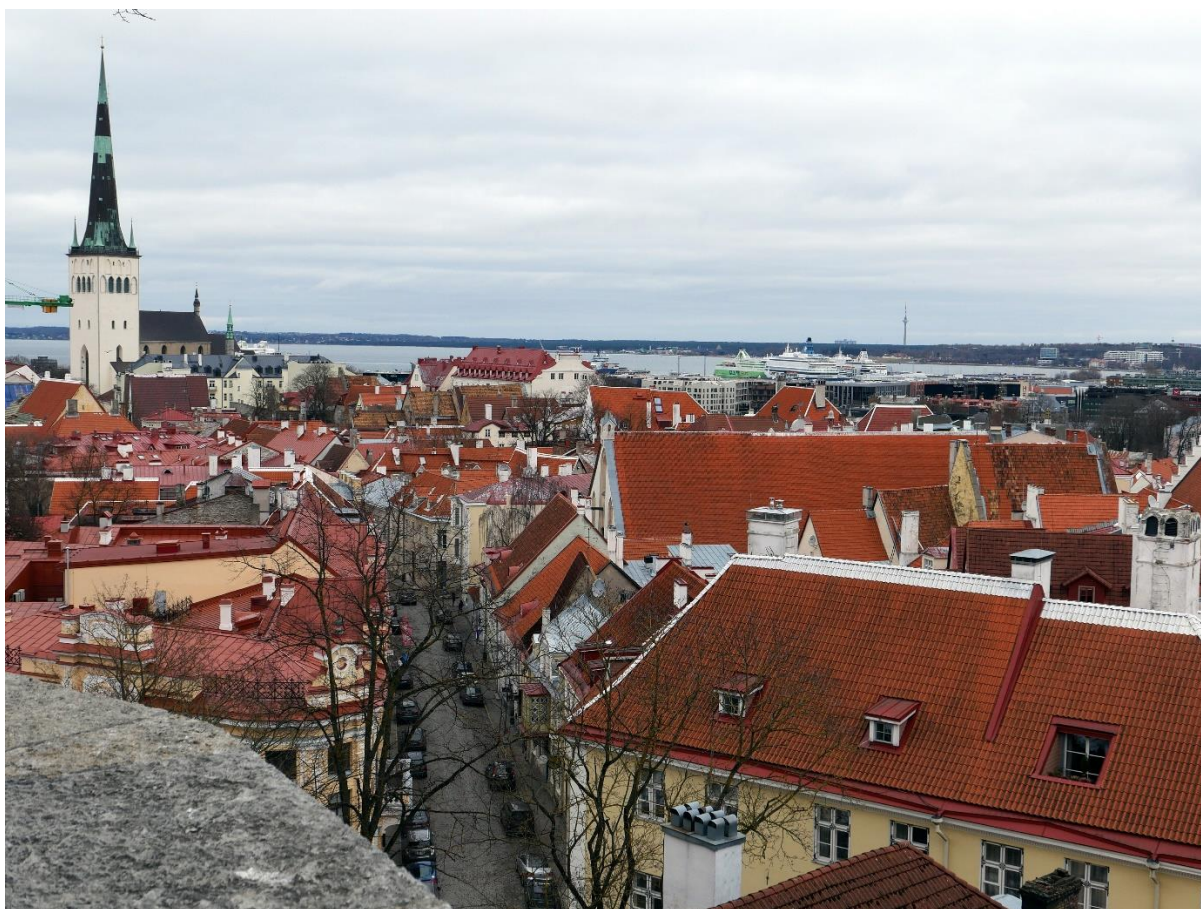
Pogled na stari del mesta Tallinn

Od 7. do 11. 3. 2022 je v glavnem mestu Estonije, Tallinnu, v okviru projekta z naslovom Geocad, potekalo srečanje dijakov in učiteljev iz Estonije, Grčije, Portugalske, Turčije in Slovenije. Srečanje je organizirala partnerska šola Kesklinna Vene gümnaasium, šola s splošnim programom, ki jo obiskujejo učenci oz. dijaki v starosti 7 – 19 let. Pouk poteka v ruščini, na šoli pa so zaposleni ruski, estonski in ukrajinski učitelji.