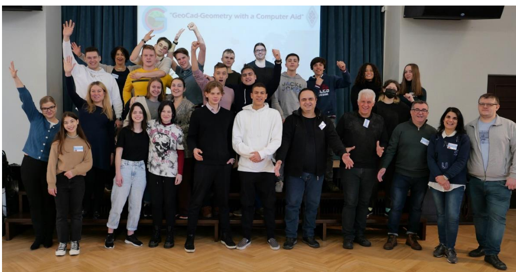
Udeleženci srečanja v Estoniji