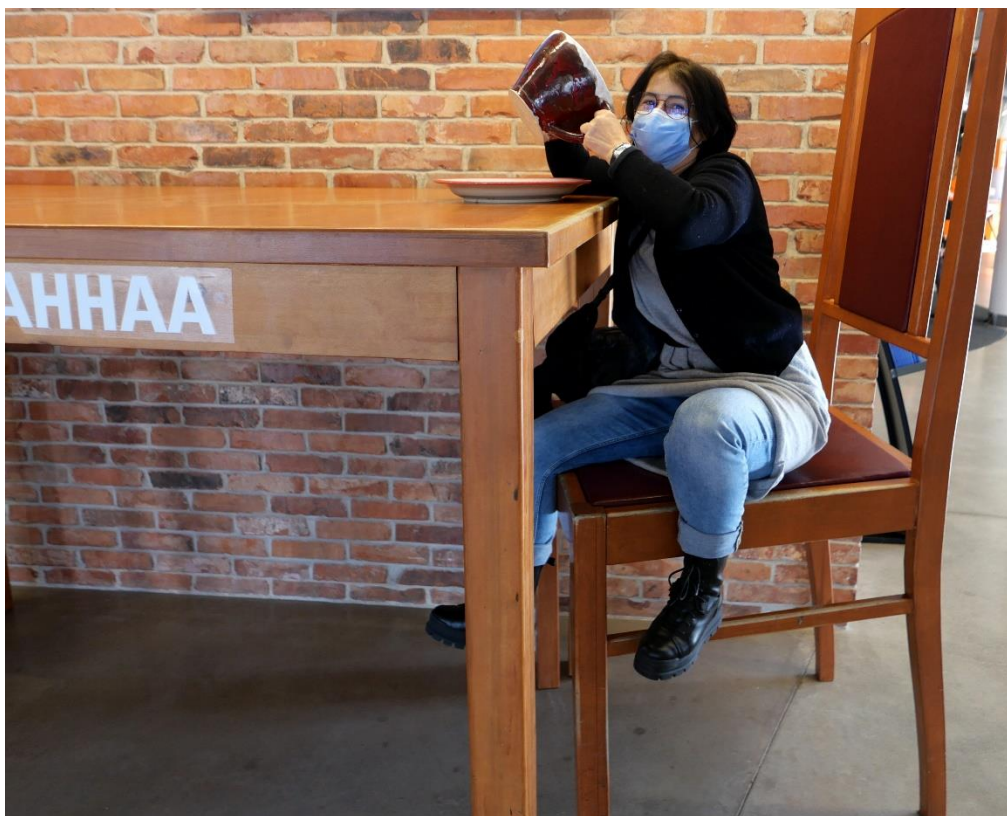
V znanstvenem centru AHAA smo se pbliže spoznali s konceptom relativnosti

Estonija nas je presenetila z visoko razvito digitalno tehnologijo in izjemnim standardom šolske učne opreme.