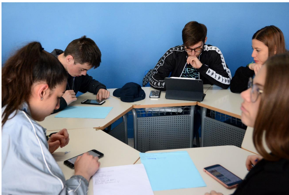
Dijaki v mešanih skupinah pripravljajo gradivo za promocijo geoparkov.