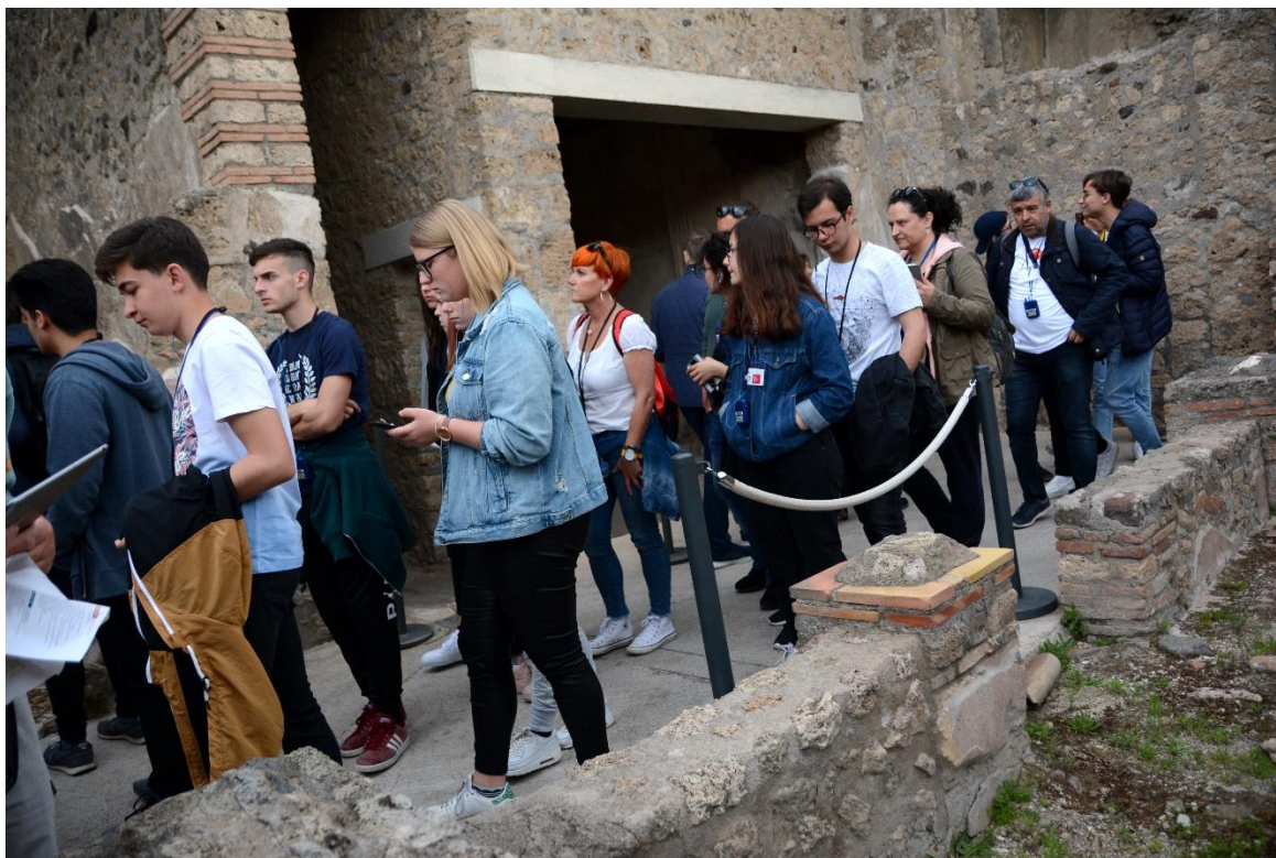
Med ogledom Pompejev.