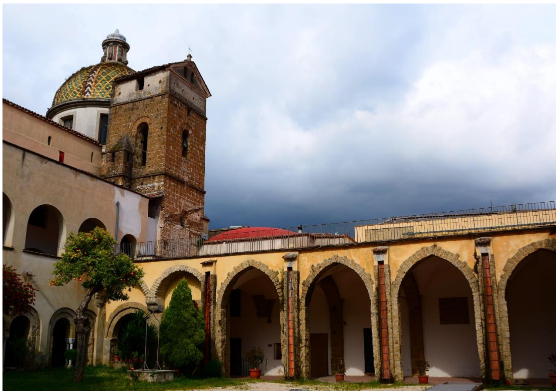
Na ogledu cerkva in samostanov mesta Aversa.