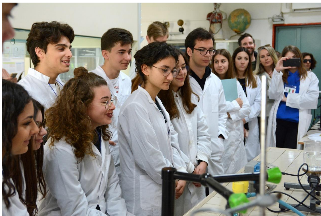
Dijaki analizirajo liste rastlin, ki so jih nabrali v geoparku.