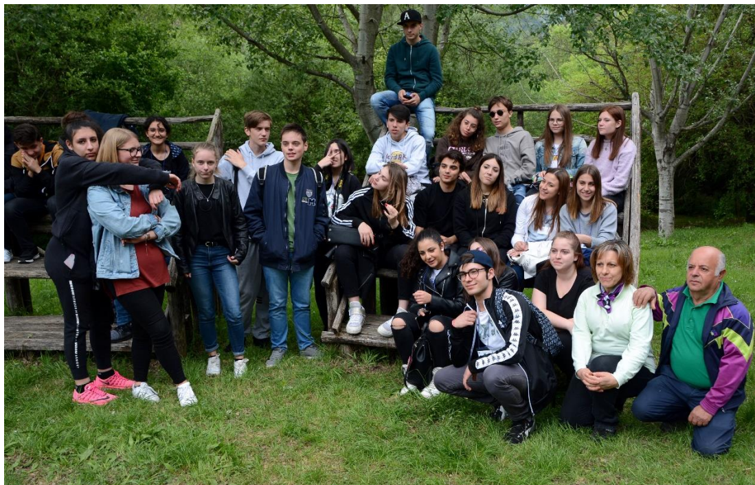
Dijaki štirih šol skupaj s strokovnimi delavci geoparka Cilento.